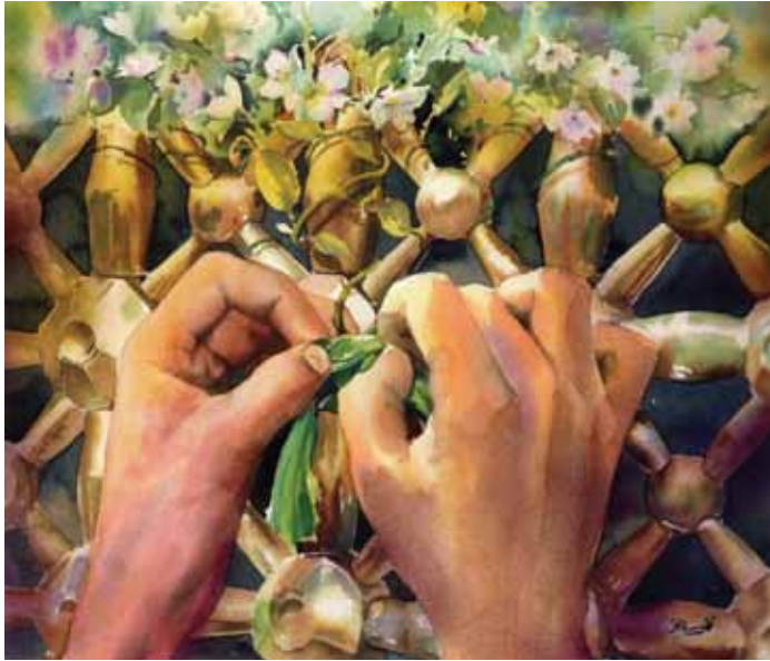
▲ آستان مقدس رضوی (ع)، آبرنگ، اثر محمود نیستانی