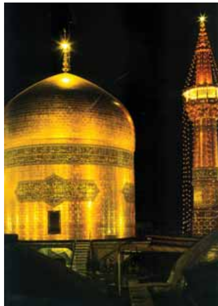
▲ آستان مقدس رضوی (ع)