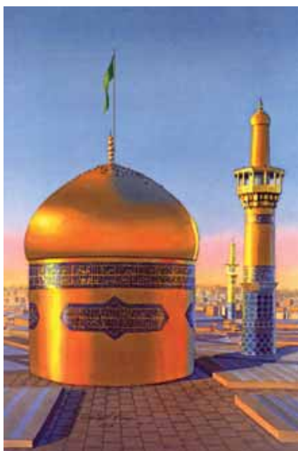
▲ آستان مقدس رضوی (ع)، آبرنگ، اثر عطاء... ذی نوری