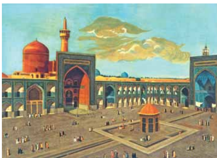
▲ آستان مقدس رضوی (ع)، رنگ روغن، اثر استاد کمال الملک