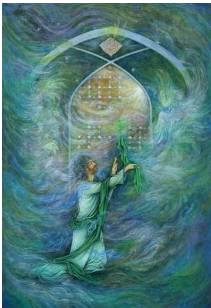
▲ شمس الشموس، مینیاتور، اثر حسام فرجی