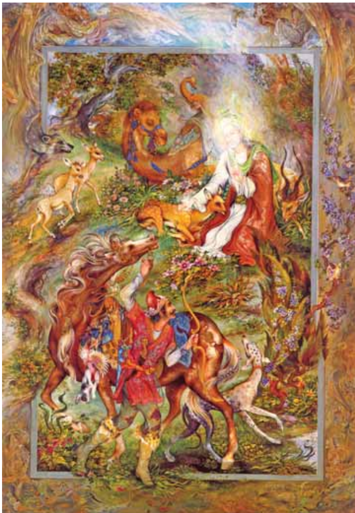
▲ ضامن آهو، مینیاتور، اثر استاد محمود فرشچیان